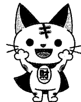
近畿財務局マスコット Kinki CATs

FAXでお申込みの方は必要事項をご記入の上、下記FAX番号までこの紙を送信してください。 お申込み頂いた方には、後日参加証をお送りします。当日お越しの際に受付へお持ちください。 また、定員(150名)になり次第、募集を締め切らせていただきます。